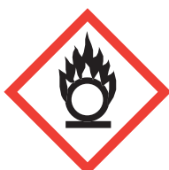
Je fais flamber