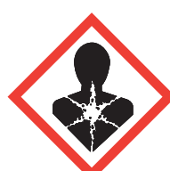
Je nuis gravement à la santé