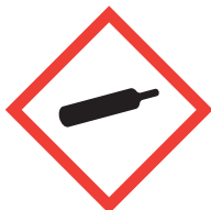
Je suis sous pression