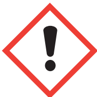
J'altère la santé ou la couche d'ozone