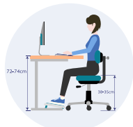
Recommandations de réglages en hauteur de l'assise et du plan de travail