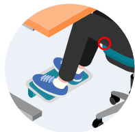
Utilisez un repose-pied pour limiter la pression sous vos cuisses