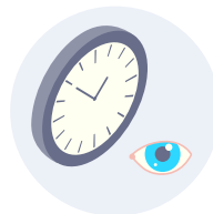
Prenez une pause toutes les heures pour reposer vos yeux