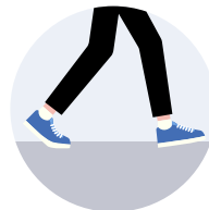
Ne restez pas dans des pauses statiques pendant de longues périodes