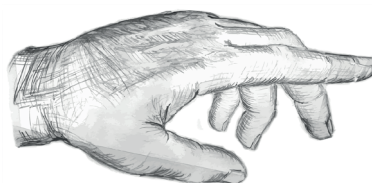
Voie cutanée (peau)