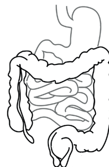
Voie digestive (ingestion)